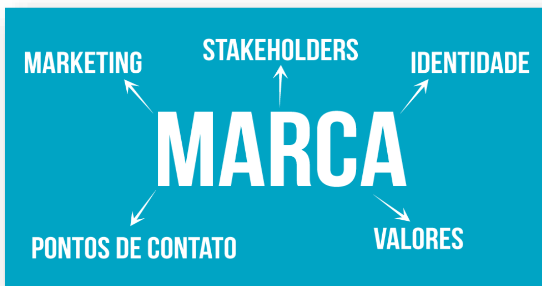
Figura 1 | Componentes da Marca

Hoje em dia, e ao contrário do que sucedia há alguns anos, abrir um negócio é uma tarefa que parece relativamente simples. No entanto, uma empresa e uma marca são muito mais que um registo formal. Mais importante que a sua constituição é a definição de uma estratégia eficaz de marketing e a definição de trâmites que lhes confirmem a devida proteção legal.